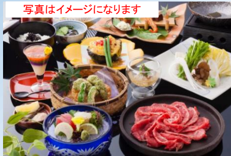
写真はイメージになります